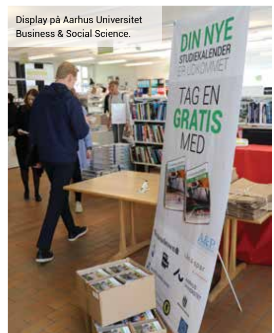
Display på Aarhus Universitet Business & Social Science.