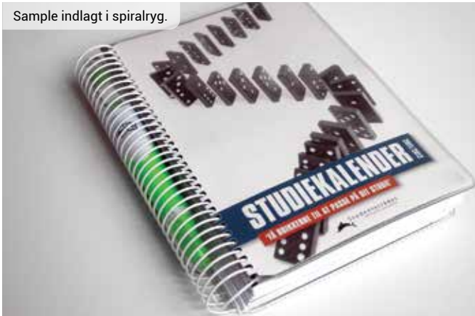
Sample indlagt i spiralryg.