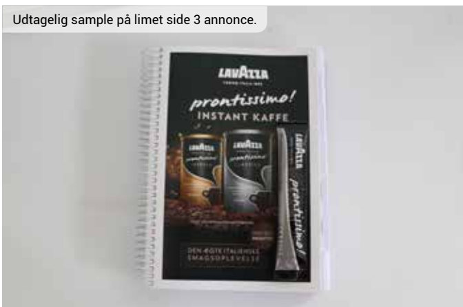
Udtagelig sample på limet side 3 annonce.