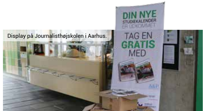
Display på Journalisthøjskolen i Aarhus.

De studerende kan blandt andet se på facebook hvornår kalenderen når deres studie.