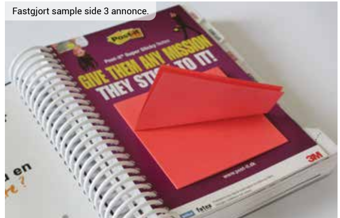
Fastgjort sample side 3 annonce.