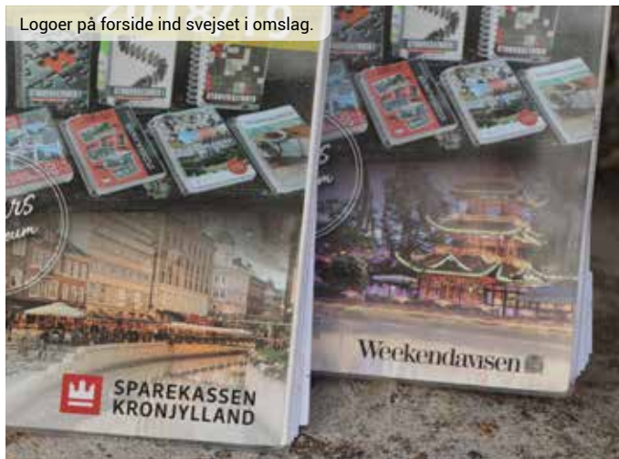
Logoer på forside ind svejset i omslag.