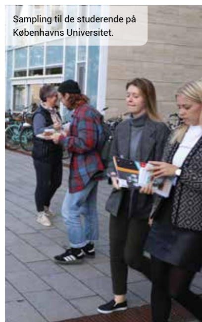
Sampling til de studerende på Københavns Universitet.