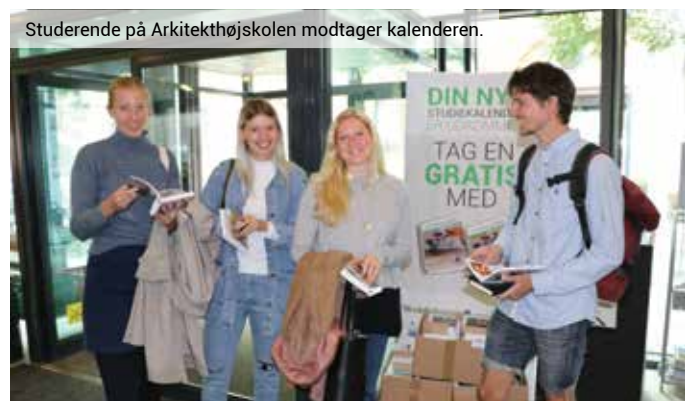
Studerende på Arkitektthøjskolen modtager kalenderen.